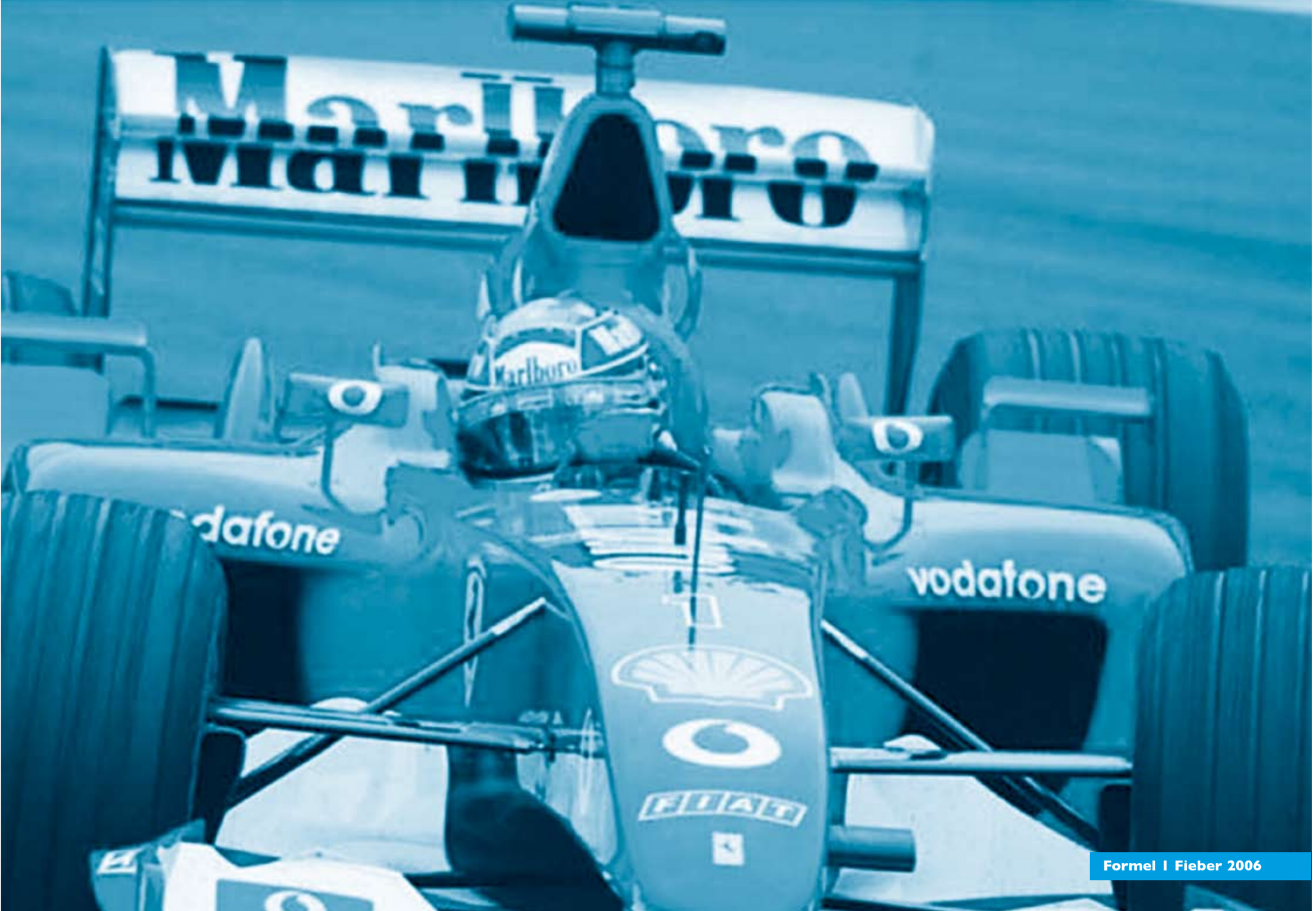
Formel 1 Fieber 2006