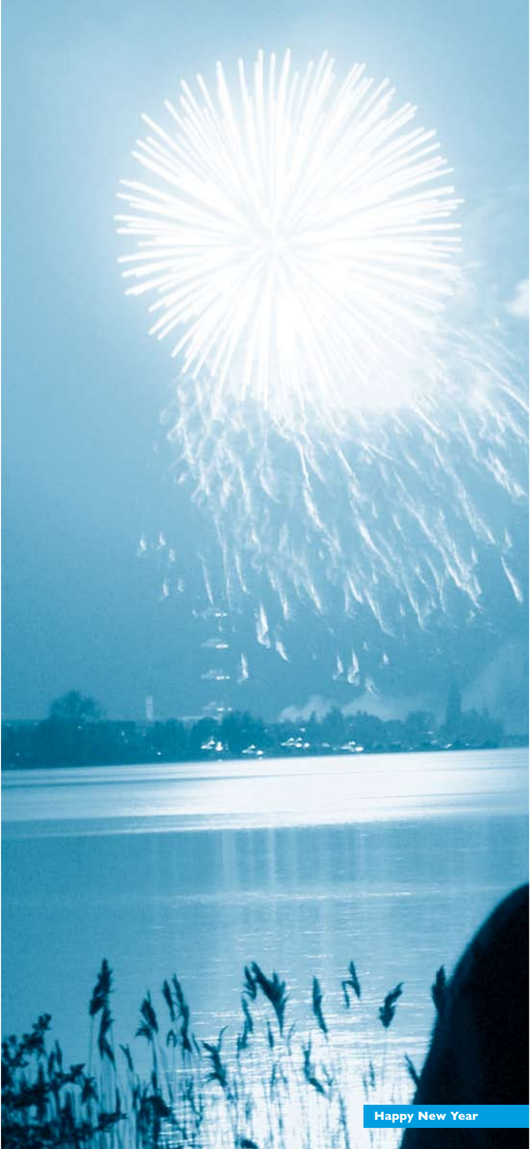
Happy New Year